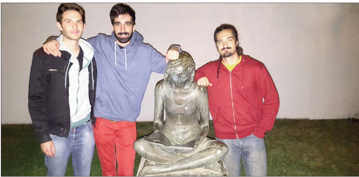
Integrantes del grupo La Brújula del Pelicano en el C.C. La Despernada

La Concejalía de Juventud ha puesto en marcha el Programa Municipal "Micros Abiertos" con el objetivo de ofrecer a los jóvenes con inquietudes musicales la oportunidad de darse a conocer. "Creemos que es un programa interesante porque, en primer lugar, sirve para dar visibilidad al trabajo artístico del colectivo juvenil de nuestro municipio y, en segundo, porque con estos conciertos ofrecemos también una alternativa de ocio al resto de los jóvenes", explica la concejala de Juventud, Rosa M.ª García.